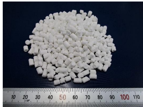
蓄熱材(ハスクレイ)