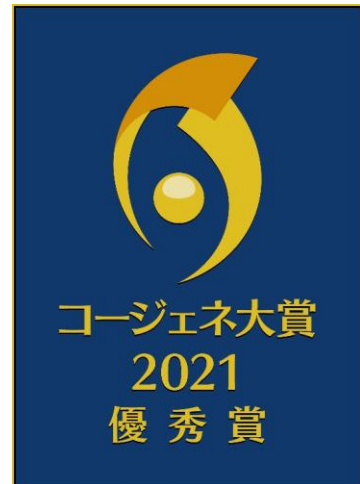
コージェネ大賞 ロゴ

「コージェネ大賞」とは、一般財団法人コージェネレーション・エネルギー高度利用センターが主催する、新規性・先導性・新規技術および省エネルギー性などにおいて優れたコージェネレーションシステム（以下、「コージェネ」）を表彰する制度です。