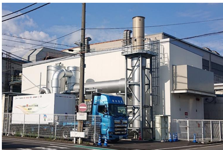
コージェネと高密度蓄熱システム 外観

上記の結果、一次エネルギー削減率※4は22.7%を達成、また、CO 2 排出量は4,830ton/年削減しました。