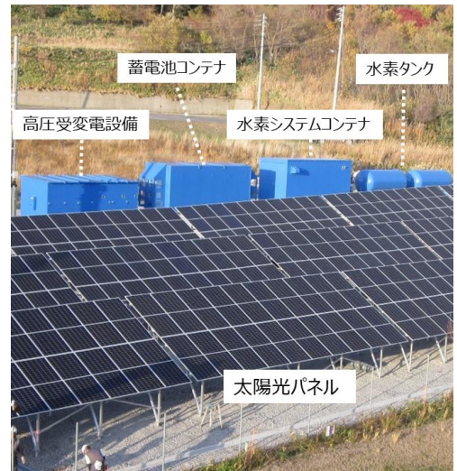
マイクログリッド 外観