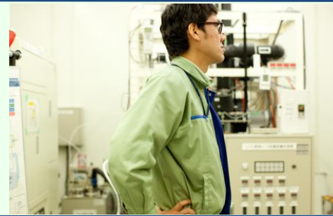
Takasago Thermal Engineering Co., Ltd.

1923年の創業以来、空調設備業界のパイオニアとして国内外の大規模建造物に最適環境を創造してきました。空調と省エネルギーのスペシャリストとして「環境」をつくる仕事を感じてみませんか？説明会では、建設業ならびに空調設備業界について分かりやすくご説明致します。