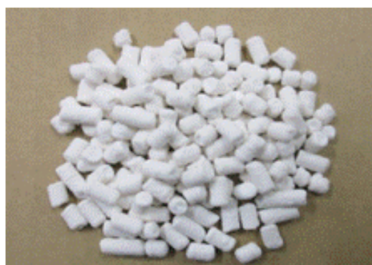
図 3 改良型ハスクレイの外観

石原産業(株)、大塚セラミックス(株)、産業技術総合研究所は共同で、従来のハスクレイをベースに、安価でかつ 500kJ/L 以上の高い蓄熱密度を実現できる蓄熱材(改良型ハスクレイ)を開発するとともに、同蓄熱材の量産製造技術を確立しました(図 3)。従来のハスクレイは、水蒸気の吸脱着(蓄放熱)性能は優れていますが、合成時に 180°C 以上の高温条件が必要であり、高温合成時の圧力に耐える特殊容器を用いることなどが高コスト化の要因となっていました。今回、石原産業(株)らは、非晶質アルミニウムケイ酸塩(ハスクレイ前駆体)を基に、100°C 以下での合成が可能となる製造工程を構築すると同時に、材料組成の改良や造粒条件の最適化を図ることでハスクレイを構成する各元素の偏在を少なくし、安価でかつ高蓄熱密度が実現できる改良型ハスクレイの製造技術を確立しました。同蓄熱材を 100°C で再生した際の蓄熱密度は 588kJ/L であり、従来のハスクレイの蓄熱密度 524kJ/L を超える性能を有することを確認しました。さらに、石原産業(株)は蓄熱材の量産合成と造粒方法において製造技術のスケールアップを図り、1,000 トン/年レベルの生産を可能とする量産製造技術を確立しました(図 4)。今後は、開発した蓄熱材の市場投入に向けて、信頼性を確認していくとともに、量産製造時に製品単価として 1,000 円/kg を実現するための量産工程および製造システムを検討していきます。