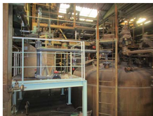
図 4 量産製造装置の外観